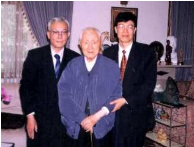
陳會長、陳立夫資政、何永慶社長